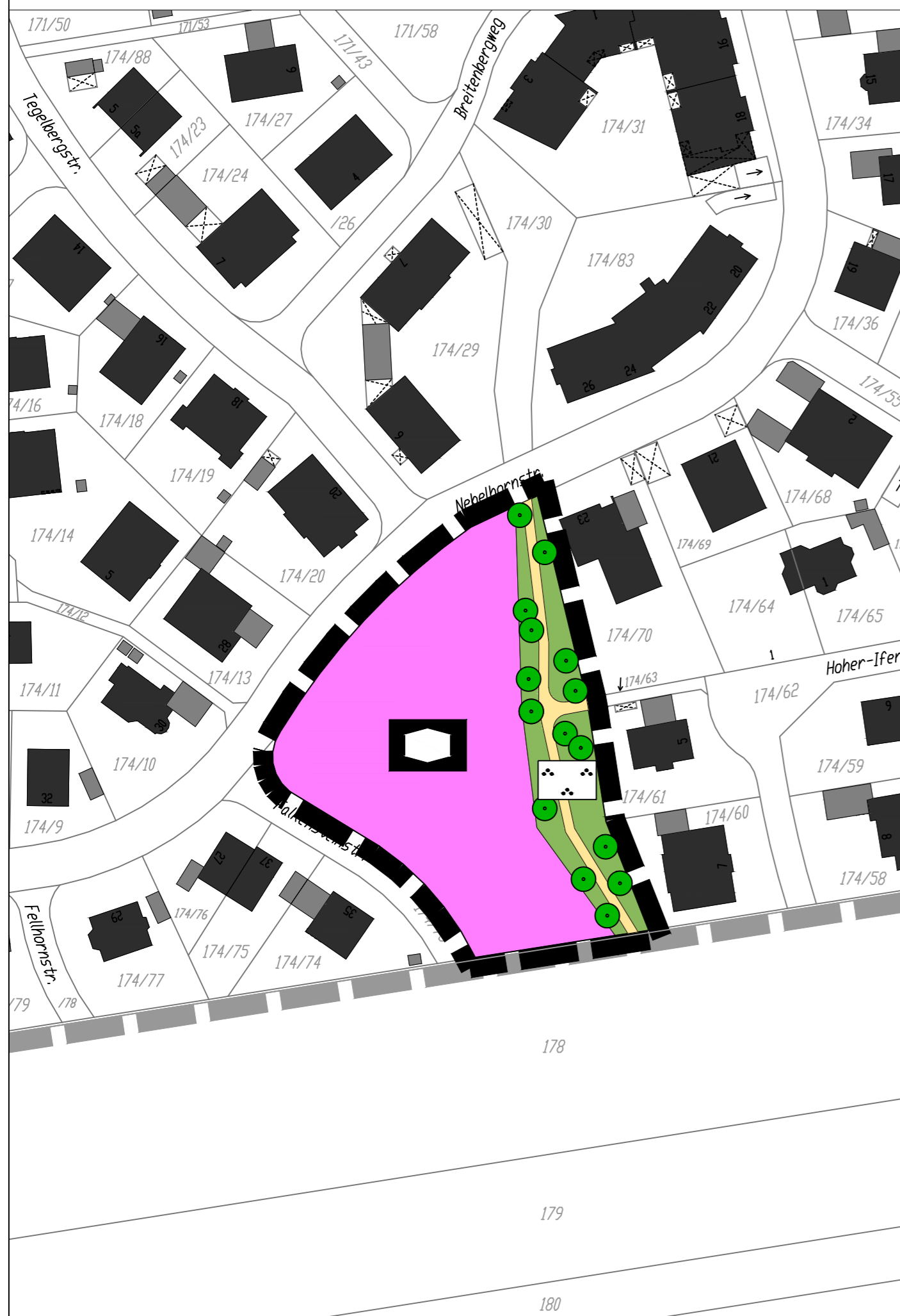
A AUSZUG AUS DEM RECHTSKRÄFTIGEN BEBAUUNGSPLAN NR. 20 "SÜD III"