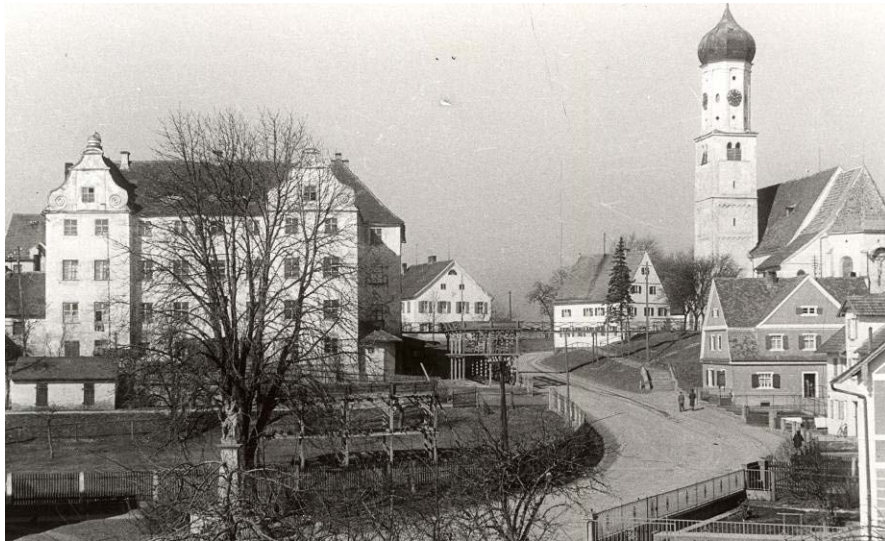
Blick Richtung Schloss und Kirche 1949