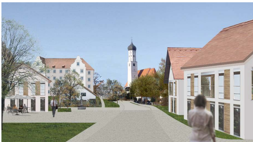
Visualisierung zukünftiger Blick Richtung Schloss und Kirche