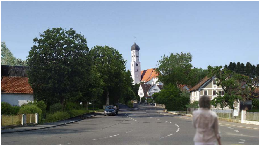
Blick Richtung Schloss und Kirche heute