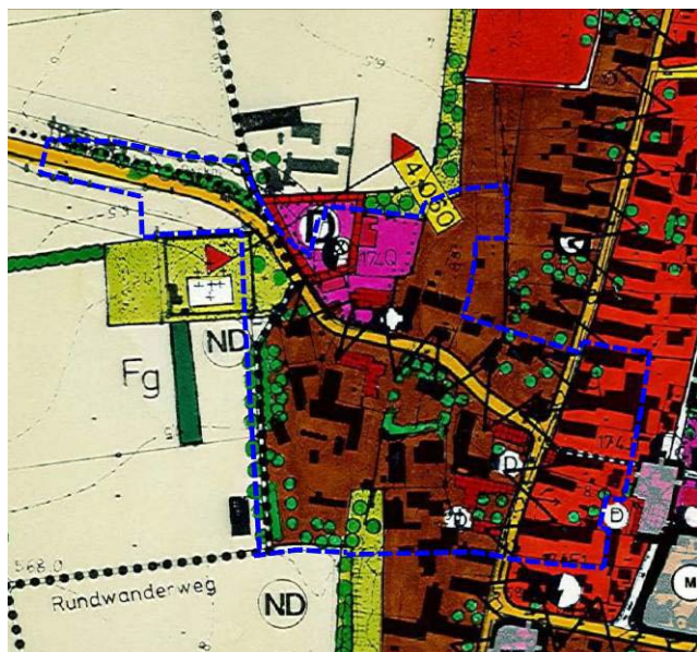
Ausschnitt aus dem wirksamen Flächennutzungsplan der Gemeinde Untermeitingen mit Geltungsbereich des Bebauungsplanes Nr. 44 „Am Schlossberg“ (blaue Umgrenzung)

Der Flächennutzungsplan stellt das Umfeld des Geltungsbereiches im Nordwesten, Südwesten und Westen als Flächen für die Landwirtschaft, im Norden und Süden als Gemischte Baufläche und im Nordosten, Südosten und Osten als Wohngebiet dar.