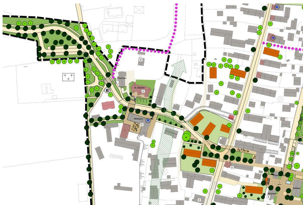
Ausschnitt Rahmenplan, Stand März 2012

Um die entsprechenden Ziele und Maßnahmen rechtsverbindlich umsetzen zu können, beschloss der Gemeinderat die Aufstellung dieses Bebauungsplanes.