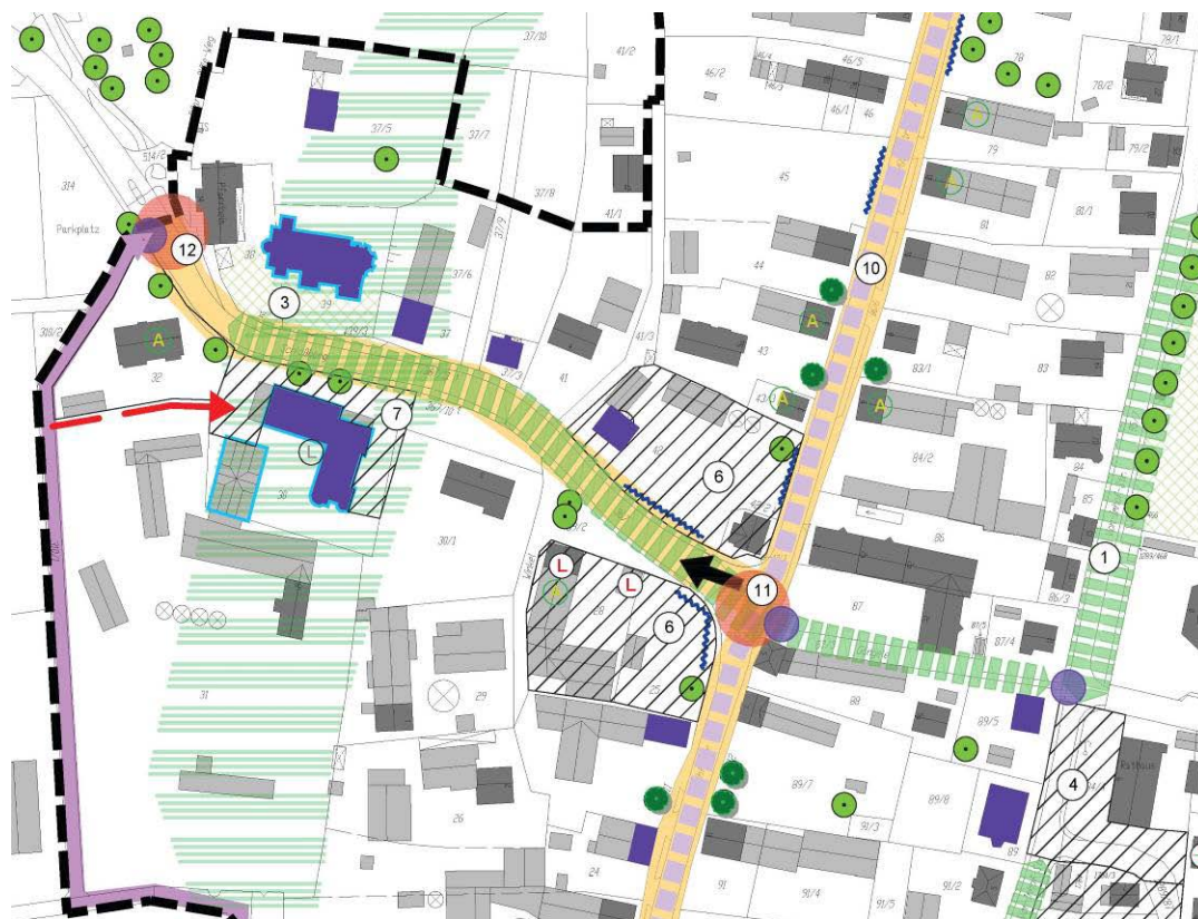
Ausschnitt Zielplan, Stand März 2012

Aufgrund des Handlungsbedarfs im Altortbereich von Untermeitingen wurde im Rahmen dieses Entwicklungskonzepts als kommunale Maßnahme der Ortskern vertieft untersucht.