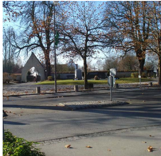
Prägender Baumbestand am Friedhof

Der Platz am 'Gängele' verfügt über einen noch relativ jungen Baumbestand (Linden), der jedoch willkürlich angeordnet ist und den Platz eher vom Straßenraum abriegelt als verbindet. Im Osten dieses Platzbereiches befindet sich ein kleiner Kinderspielplatz.