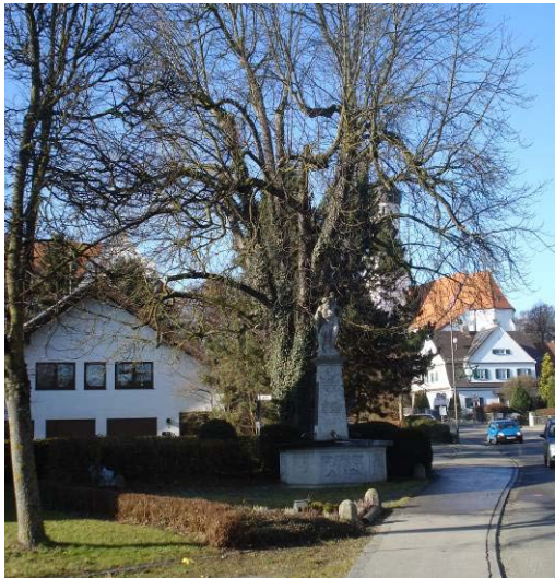
Kastanien am Kriegerdenkmal

Im Planungsumgriff sind nur wenige prägende Grünstrukturen vorhanden. Insbesondere das Umfeld des Friedhofs weist einen älteren und prägenden Baumbestand auf. Entlang der Straße Schloßberg wurden im Bereich des Schlosses straßenbegleitende Bäume gepflanzt, die sich positiv auf den Straßenraum, der ansonsten wenig Aufenthaltsqualität aufweist, auswirken. Im östlichen Straßenabschnitt an einer Aufweitung im Straßenraum befindet sich das Kriegerdenkmal mit zwei alten und mächtigen Kastanien. Der alte Baumbestand und der kleine Platz bilden einen dörflichen Aufenthaltsbereich und gliedern den ansonsten für Fußgänger unattraktiven Straßenraum.