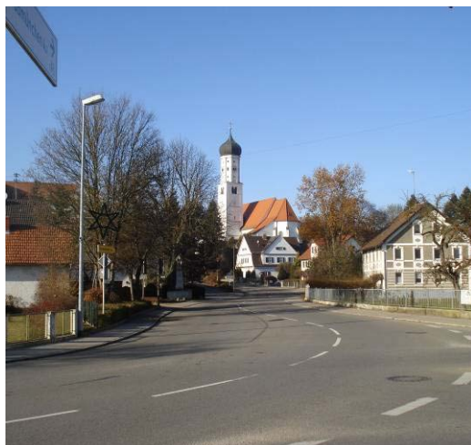
Durch Baumbestand und Gebäude verstelltes Schloss