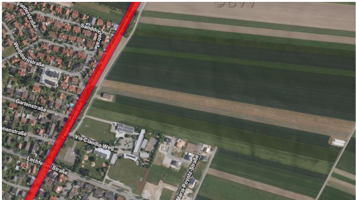
Abbildung 1: Lage Bodendenkmal D-7-7830-0010

Gemäß Information des Landesamts für Denkmalpflege befindet sich im Westen des Planungsgebiets das Bodendenkmal D-7-7830-0010, Straße der römischen Kaiserzeit . Es verläuft im Bereich der Feuertornstraße von Nordosten nach Südwesten in einem etwa 20 m breiten Band. Weitere Fundorte aus der Römerzeit können nicht vollständig ausgeschlossen werden.