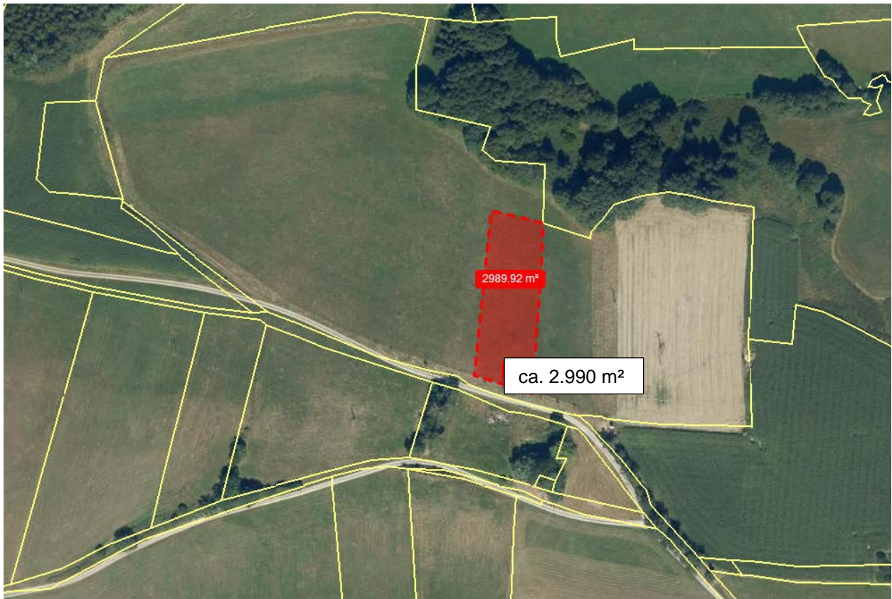
Abbildung 2 Teilfläche des Grundstücks Fl.Nr. 436 der Gemarkung Reichertshofen, auf dem der Ausgleich für die vorliegende Bebauungsplanänderung erbracht wird

Der durch die 1. Änderung des Bebauungsplanes L 25 verursachte Eingriff in Natur und Landschaft (Ausgleichsbedarf 2.982 m 2 ) kann auf der angegebenen Ausgleichsfläche Flurstück 436 in Reichertshofen außerhalb des Planungsgebietes in geeigneter Weise vollständig kompensiert werden.