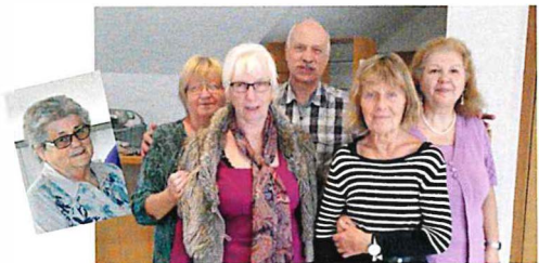
Das Team vom Gräbinger Mittagstisch

Über Ihr Kommen würden wir uns sehr freuen!