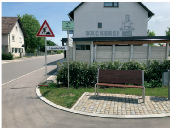
Lechfelder Straße, Graben

In Österreich und Norddeutschland ist das Modell sehr verbreitet. Ziel ist es, das Verbindungsangebot zu verbessern.