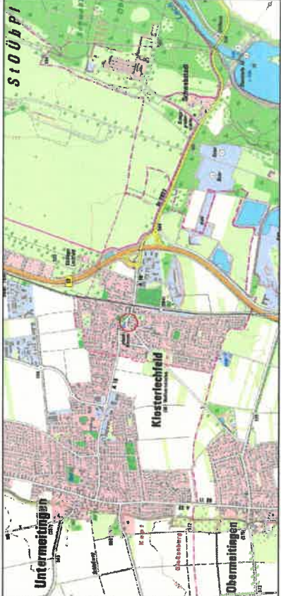
AUSZUG AUS DER TOPOGRAPHISCHEN KARTE, OHNE MASSSTAB