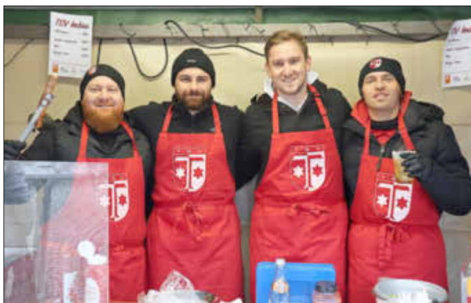
Auf dem Klosterlechfelder Weihnachtsmarkt waren die TSV-Fußballer wieder vertreten.

Auf der faulen Haut liegen die Klosterlechfelder Fußballer aber nicht. Beim Weihnachtsmarkt verwöhnten die Spieler die Kunden und Kundinnen mit heißen Caipirinhas und feurigen Bosna.