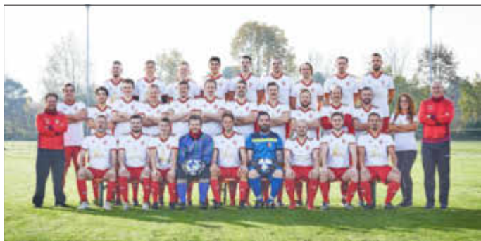
Die Fußballer des TSV Klosterlechfeld haben neue Mannschaftsfotos.

Die Herbstrunde ist für die Fußballer des TSV Klosterlechfeld nun beendet. Die sportliche Bilanz fällt unterschiedlich aus. Alle drei Mannschaften haben in jedem Fall Vollgas gegeben und vollen Einsatz gezeigt. Besonders hervorzuheben ist das Abschneiden der Ersten Mannschaft in der A-Klasse Augsburg Süd.