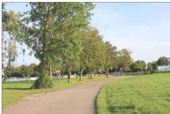
Der Inselgrill soll links dieses Wegs beim Sportplatz gebaut werden