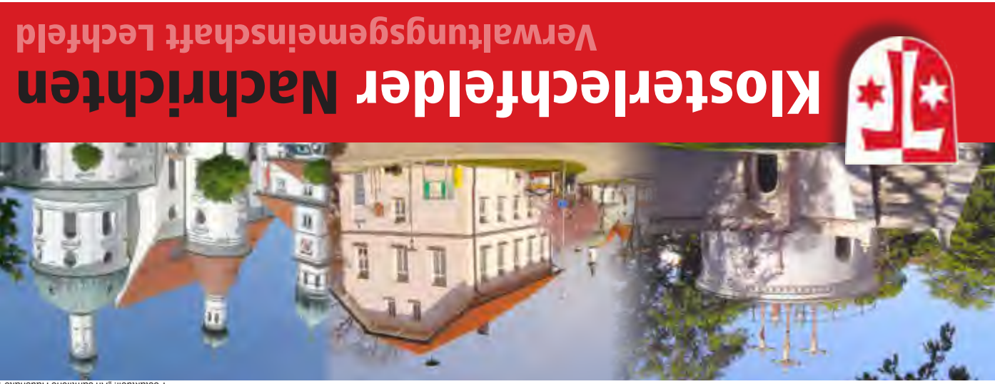
Postaktuell: „An sämtliche Haushalte“