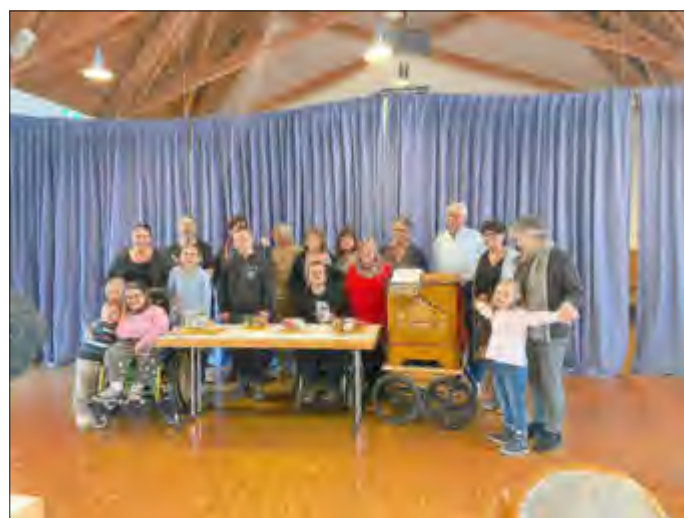
Text und Bild: Magdalena Klein