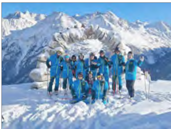
Vorbereitung der Schneesportlehrer/-innen Alpin und Snowboard in Sölden

Für Fragen, Informationen und Absprachen stehen Abteilungsleiterin Gabi Weser per Email: info@svu-snowboard.ski – und telefonisch unter 08232 3720 sowie die Sportwarte Alpin Ines Lauber und Snowboard Harald Krings zur Verfügung.