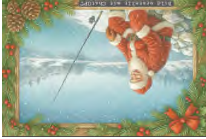
Euer Fischerverein Obermöttlingen