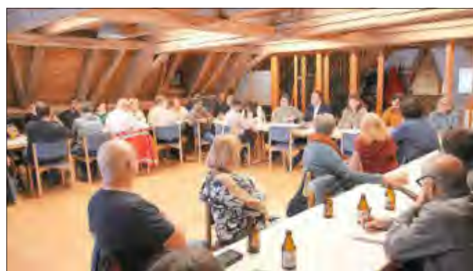
Die Vereinsvertreter trafen sich zum gemeinsamen Austausch im historischen Bürgersaal des Hauses Imhof.

Die Gemeinde Untermeitingen hat erneut die ehrenamtlichen Vertreter der örtlichen Vereine zu einer Besprechung im Bürgersaal des Hauses Imhof eingeladen. Bei dem halbjährlichen Treffen ging es wie gewohnt um die Abstimmung von Veranstaltungsterminen sowie den Austausch aktueller Informationen zwischen Gemeinde und Vereinswelt.