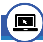
2025 Klosterlechfeld

Online bestellen unter: https://angelfreunde-lechfeld.de